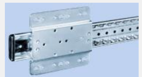
Beispiel Schock Kugelführungen

Mit Innovafinance konnten die Anforderungen von Schock Metall, wie z.B. strukturelle Optimierungen, Segmentberichtserstattung und die Berücksichtigung der Gesetzgebung wie SEPA und E-Bilanz, umfassend abgebildet werden. Neue Lösungen wie Cash- und Liquiditätsmanagement, Kundenzahlungsverhaltensstatistik oder die Übernahme der Absatzplanung im Controlling führen nicht nur zu immer aktuellen Zahlen aus Finanzbuchhaltung und Controlling, sondern auch zu Optimierungen im gesamten Ablauf der Finanzbuchhaltung.